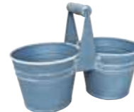
クレールポット / 2P

WCP25-P02 NEW w 23 d 11.5 h 16.5cm (ポット部 Φ 10.5 h 8.5cm) JAN 936541 Lot: 4 (32 入) ¥1350 ブルーグレー ●穴あり *PVC ライナー付