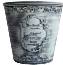
ブラッシュポット / pot M

PBP25-20A NEW Φ 20 h 19cm JAN 936909 Lot: 4 (80 入) ¥800 AS ●穴あり