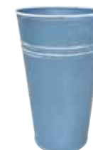
クレールポット / トール

WCP25-T20 NEW Φ 13.5 h 20cm JAN 936589 Lot: 4 (80 入) ¥700 ブルーグレー ●穴あり *PVC ライナー付