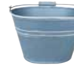
クレールポット / ハンドルオーバル

WCP25-HB15 NEW w 19 d 13.5 h 20cm (コンテナ部 w 17 d 12.5 h 11.5cm) JAN 936619 Lot: 4 (120 入) ¥750 ブルーグレー ●穴あり *PVC ライナー付