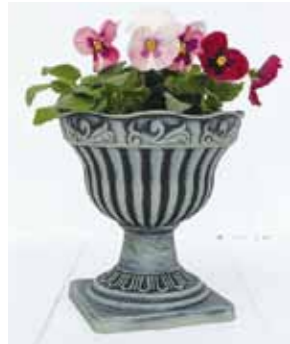
ブラッシュポット / コプレット CS

PBG25-C20A NEW Φ 20 h 20.5cm (ポット部 h 12cm) (台座部 w 14.5 d 14.5cm) JAN 937487 Lot: 4 (80 入) ¥950 AS ●穴なし ●組立て式