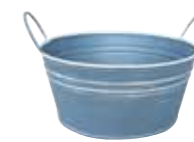
クレールポット / ラウンド S

WCP25-R15 NEW w 20.5 d 17.5 h 12cm (コンテナ部 Φ 17 h 8cm) JAN 936602 Lot: 4 (100 入) ¥700 ブルーグレー ●穴あり *PVC ライナー付