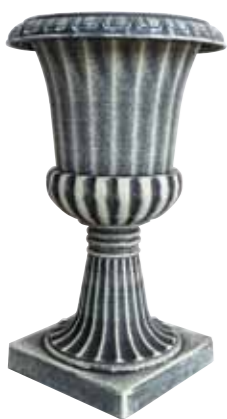
ブラッシュポット / コプレット A

PBG25-A20A NEW Φ 20.5 h 35cm (ポット部 Φ 16.5 h 18.5cm) (台座部 w 16 d 16cm) JAN 936848 Lot: 4 (60 入) ¥1600 AS ●穴なし ●組立て式