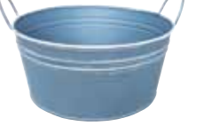
クレールポット / ラウンド M

WCP25-R20 NEW w 23 d 20.5 h 13cm (コンテナ部 Φ 19.5 h 9.5cm) JAN 936596 Lot: 4 (80 入) ¥850 ブルーグレー ●穴あり *PVC ライナー付