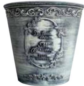
ブラッシュポット / pot L

PBP25-25A NEW Φ 25 h 23.5cm JAN 936923 Lot: 4 (50 入) ¥1300 AS ●穴あり