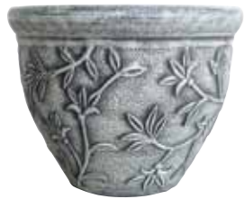
ブラッシュポット / モルティエ A

PBM25-A25A NEW Φ 24.5 h 19cm JAN 936862 Lot: 4 (50 入) ¥950 AS ●穴あり