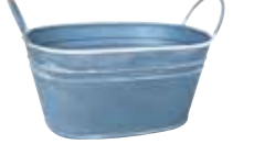
クレールポット / オーバル S

WCP25-B15 NEW w 21 d 13 h 12cm (コンテナ部 w 17.5 d 12 h 8.5cm) JAN 936626 Lot: 4 (120 入) ¥600 ブルーグレー ●穴あり *PVC ライナー付