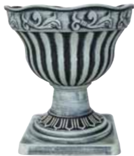
ブラッシュポット / コプレット CM

PBG25-C25A NEW Φ 24.5 h 25.5cm (ポット部 h 15.5cm) (台座部 w 18 d 18cm) JAN 937463 Lot: 4 (60 入) ¥1500 AS ●穴なし ●組立て式