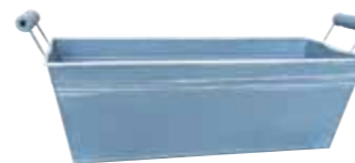
クレールポット / 長角

WCP25-B30 NEW w 38 d 14 h 14.5cm (コンテナ部 w 31.5 d 13 h 10.5cm) JAN 936633 Lot: 4 (60 入) ¥1200 ブルーグレー ●穴あり *PVC ライナー付