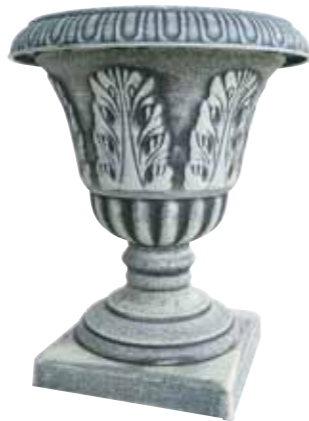
ブラッシュポット / コプレット B

PBG25-B30A NEW Φ 29 h 34cm (ポット部 Φ 24.5 h 21.5cm) (台座部 w 19 d 19cm) JAN 936800 Lot: 2 (30 入) ¥2300 AS ●穴なし ●組立て式