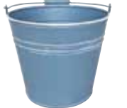
クレールポット / ハンドル M

WCP25-H15 NEW w 16.5 d 16 h 24cm (ポット部 Φ 15.5 h 13.5cm) JAN 936565 Lot: 4 (80 入) ¥700 ブルーグレー ●穴あり *PVC ライナー付